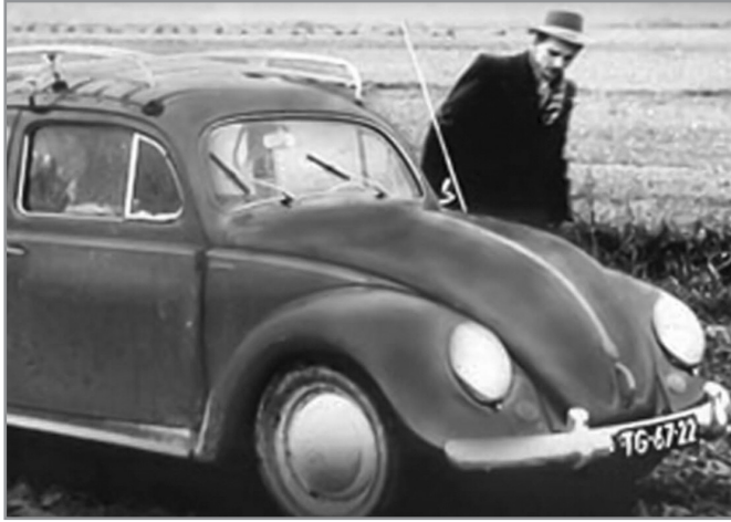
Ο Brother Andrew με το αυτοκίνητό του

Συνήθισε να προσεύχεται καθώς περνούσε τα σύνορα με Γραφές: «Κύριε, στις αποσκευές μου έχω Γραφές που θέλω να δώσω στα παιδιά Σου. Όταν ήσουν στη γη, έκανες τα τυφλά μάτια να βλέπουν. Τώρα προσεύχομαι να κάνεις τα μάτια που βλέπουν να μην βλέπουν».