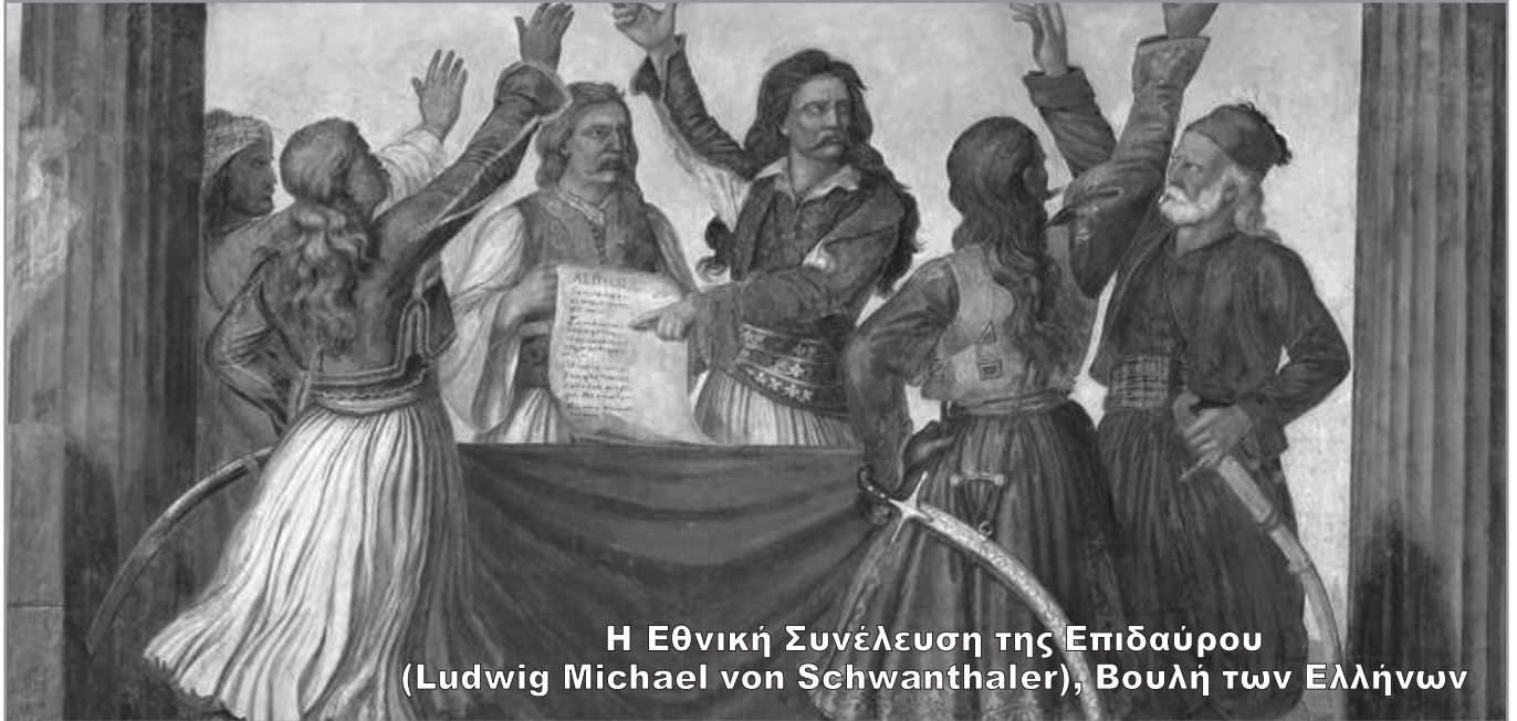
Η Εθνική Συνέλευση της Επιδαύρου (Ludwig Michael von Schwanthaler), Βουλή των Ελλήνων

Κ αθώς φεύγει το 2021, ολοκληρώνονται και οι εορτασμοί για τα 200 χρόνια από την αποτίναξη του οθωμανικού ζυγού. Μερικά χρόνια αργότερα, μετά την έκρηξη της Επανάστασης και με την άφιξη του πρώτου κυβερνήτη, Ιωάννη Καποδίστρια, στην Ελλάδα, μπαίνουν τα θεμέλια του Νεοελληνικού Κράτους και ξεκινάει η επιχείρηση αποκατάστασης του Ελληνικού Έθνους σε όλα τα επίπεδα.