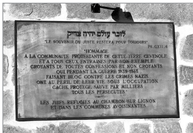
Αναμνηστική πιλάκα στο Yad Vashem αφιερωμένη στους κατοίκους του Le Chambon-sur-Lignon και της ευρύτερης περιοχής, για τη διάσωση χιλιάδων Εβραίων και Εβραιόπουλων στη διάρκεια του Δευτέρου Παγκοσμίου Πολέμου.

Όταν η Γαλλία έπεσε στα χέρια των Ναζί τον Ιούνιο του 1940, αρχικά μια περιοχή νότια του ποταμού Λίγηρα (Loire), παρέμεινε υπό την εξουσία της γερμανόφιλης Κυβέρνησης του Βισύ (Vichy) που σχηματίστηκε από τον στρατάρχη Πεταίν (Pétain). Μέσα σε λίγες εβδομάδες