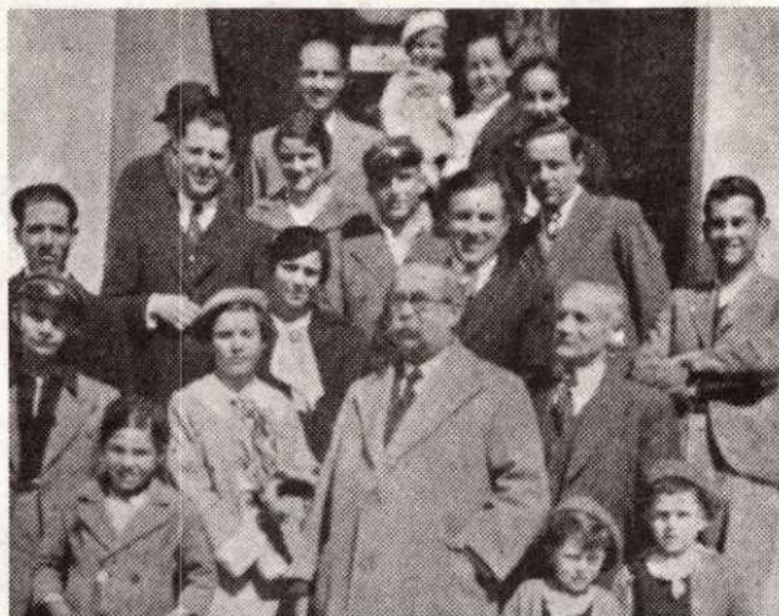
Χανιά Ιούλιος 1945.