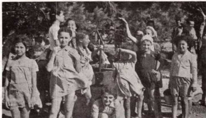
90% στο πρώτο στάδιο της φυματίωσης. Απρίλιος - Ιούλιος 1948.

είπε ότι από μια ομάδα εβδομήντα πέντε ευαγγελικών παιδιών, μόνο εφτά ήταν υγιή. Υπάρχει μεγάλη ανάγκη ενός προληπτικού σταθμού όπου τα ευαγγελικά παιδιά μας θα μπορούσαν να φροντίζονται από τρεις μέχρι έξη μήνες ωσότου ξεφύγουν εντελώς τον κίνδυνο της φυματίωσης. Αυτό θα δώσει στους αδελφούς μας μεγάλη ανακούφιση απ' τη φροντίδα για την υγεία των παιδιών τους. Συγχρόνως, θα χρησιμεύσει σαν υπέροχη ευκαιρία για να ξαναχτίσει τις συντετριμμένες απ' τον πόλεμο ζωές τους γύρω από την αγάπη του Θεού του Πατέρα μας. (Ιούλιος '46).