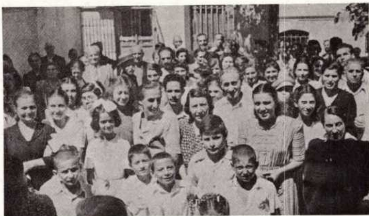
Θεσσαλονίκη Ιανουάριος - Μάρτιος 1947.

Επιστρέφοντας στην Αθήνα από την νότια Ελλάδα, λαχταρούσα να επισκεφτώ την βορειοανατολική Ελλάδα, την επαρχία της Θράκης... Όπως μου έχουν πει, εκεί ζουν περίπου 200.000 Τούρκοι που δεν ανταλλάχτηκαν το 1922. Τι σπουδαία ευκαιρία που μας δίνεται να πλησιάσουμε τους Τούρκους στην Ελλάδα, μια και δεν μπορούμε να πλησιάσουμε τους Τούρκους στην Τουρκία! Οι τελευταίοι βανδαλισμοί στην Κωνσταντινούπολη, που είχαν σαν αποτέλεσμα να καταστραφούν περιουσίες των Ελλήνων εκεί, που έφθαναν τα 300 εκατομμύρια δολάρια, πρέπει να μας «προκαλέσουν» και να βάλουν βάρος στην καρδιά μας, ώστε να μιλήσουμε για την λύτρωση του Ευαγγελίου στα 22 εκατομμύρια Τούρκους που είναι ακόμα χωρίς ιεραποστολή... Καθώς διακονούσα εκεί, το εδάφιο που ερχόταν στο μυαλό μου ήταν: «Σας στέλνω σαν πρόβατα ανάμεσα στους λύκους». Πόσο ευχαριστώ τον Θεό, με όλη μου την καρδιά, γιατί υπάρχουν ακόμα εκείνοι που έχουν το κουράγιο της πίστης και που θα πήγαιναν οπουδήποτε ! Ακόμα και μόνοι τους. Για να διακηρύξουν την πιο θαυμάσια ιστορία που κηρύχτηκε ποτέ.