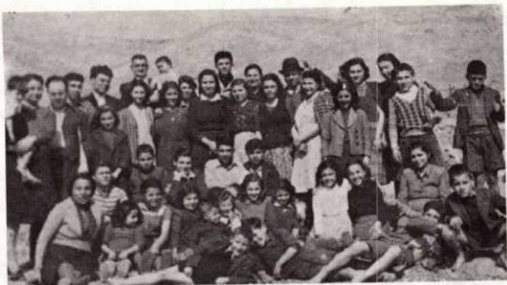
Απρίλιος - Ιούλιος 1949.

πνευματικά νοήματα μιας ομιλίας – μεταφράζεται στα αρμενικά και γίνεται μιά – στο τέλος – μικρή και σύντομη περίληψη στα ελληνικά, κυρίως για τα παιδιά που καταλαβαίνουν πιο καλά τη γλώσσα τους, γεννημένα στην Ελλάδα. Τούτη τη μορφή του... τριπλού κηρύγματος, τη γνώρισε αυτός που ιστορεί και γράφει τούτες τις γραμμές, αφού το τριπλό κήρυγμα βάσταξε μέχρι τις αρχές της δεκαετίας του '50.