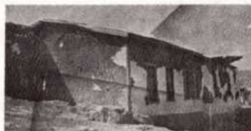
Η Εκκλησία πριν από τον βομβαρδισμό.