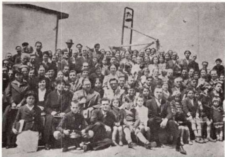
Προπολεμικά. Η Εκκλησία Λιπασμάτων.