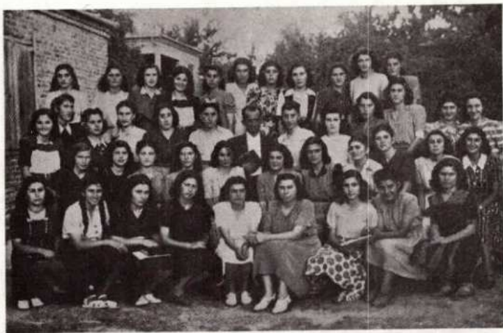
Ιανουάριος - Μάρτιος 1947.