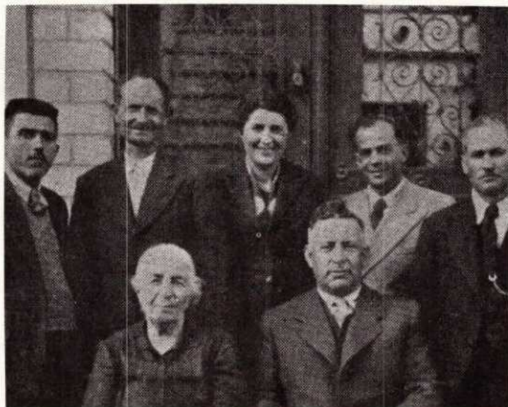
Σπάρτη Απρίλιος 1945.