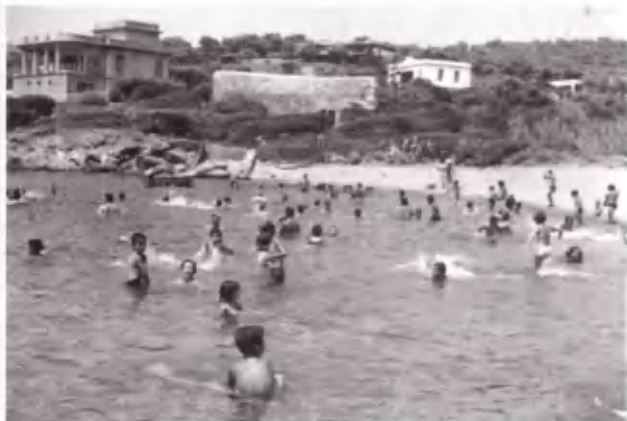
Λίγη δροσιά στο θερμό καλοκαίρι.