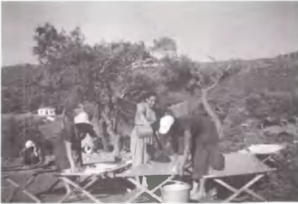
Η Κατασκήνωση απέκτησε κρεβάτια. Τι χαρά!