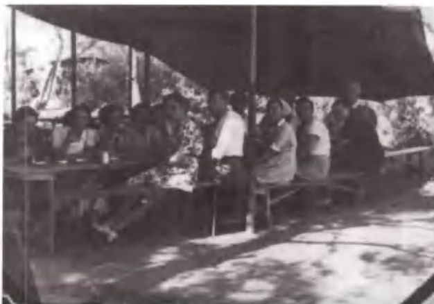
... και υπό σκιάν.