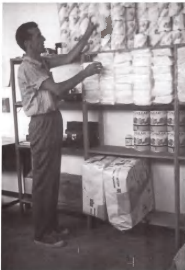
Αποθήκη: Τάξη στα μέτρα του Χαρίλαου.