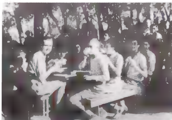
Όλοι χαρούμενοι και τρώνε με όρεξη.