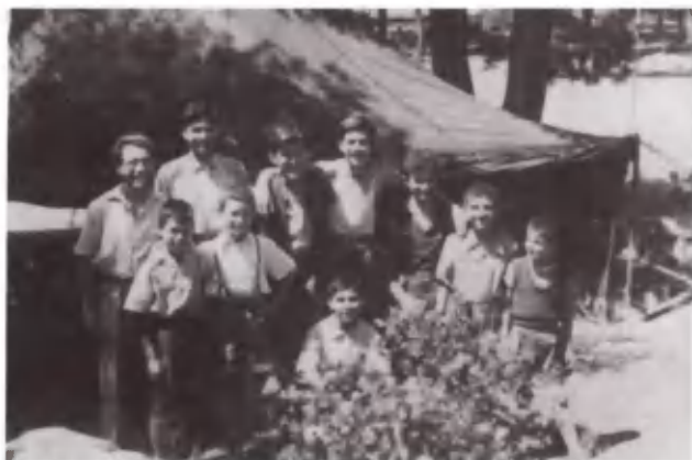
Ποιος αμφισβητεί τη χαρά τους.