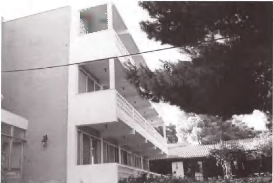
Ο Ξενώνας. Το όνειρο, επιτέλους πραγματικότητα.