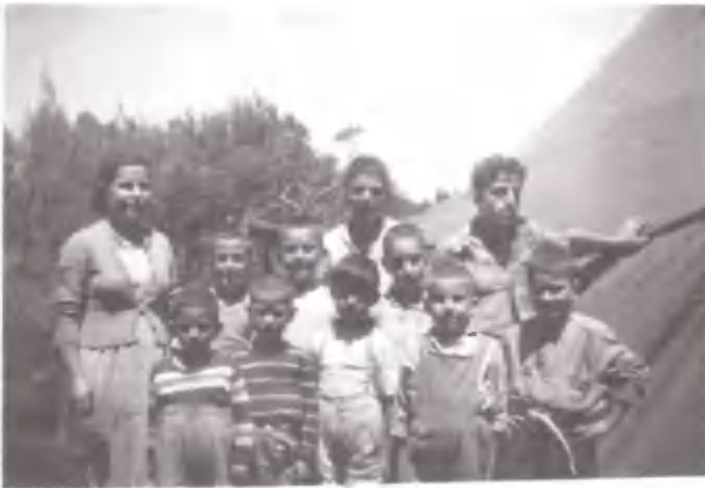
Κατασκηνωτές, επίδοξοι πολίτες του Ουρανού! Λιοντάρια, ελάφια, περιστέρια, αετοί.