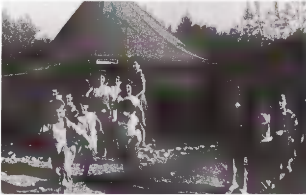
Γρήγορα, γρήγορα για το πρόγευμα.