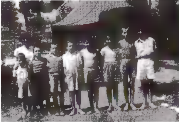
Διαβάθμιση ακριβείας στην ίδια σκηνή.