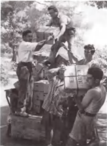
Εφόδια CARE από τις Η.Π.Α. Από την καρδιά του Υφαντίδη σ' αυτήν της Κατασκήνωσης.