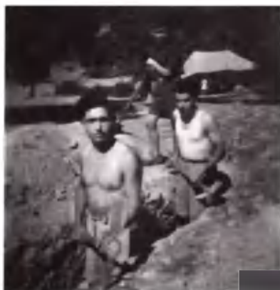
Ο μόχθος δεν ήταν μικρός.