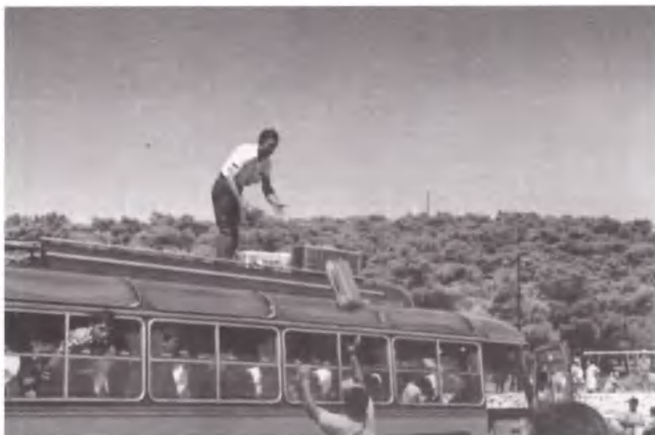
Αλλαγή φρουράς. Άφιξη νέων κατασκηνωτών.