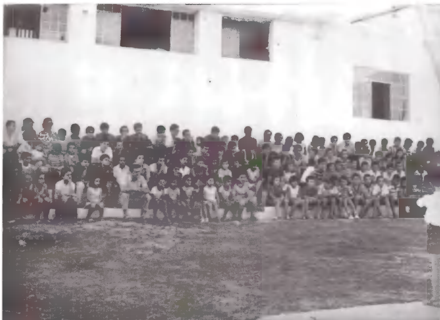
Στον παλιό χώρο της ψυχαγωγίας. Έτοιμοι για την έναρξη.