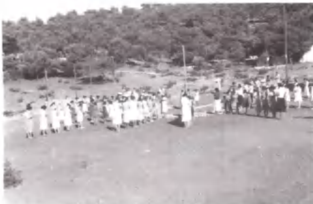
Η ανύψωση της σημαίας στις αρχικές Κατασκηνώ- σεις.