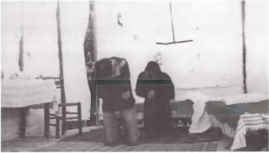
Το σκετς στη λύση του.