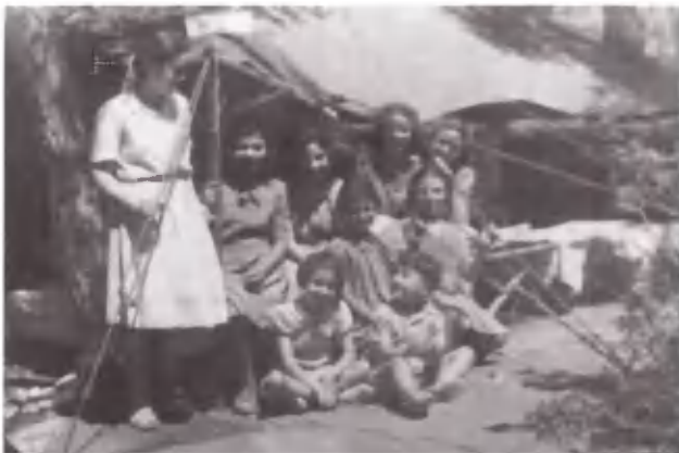
Μπουμπούκια την αυγή.