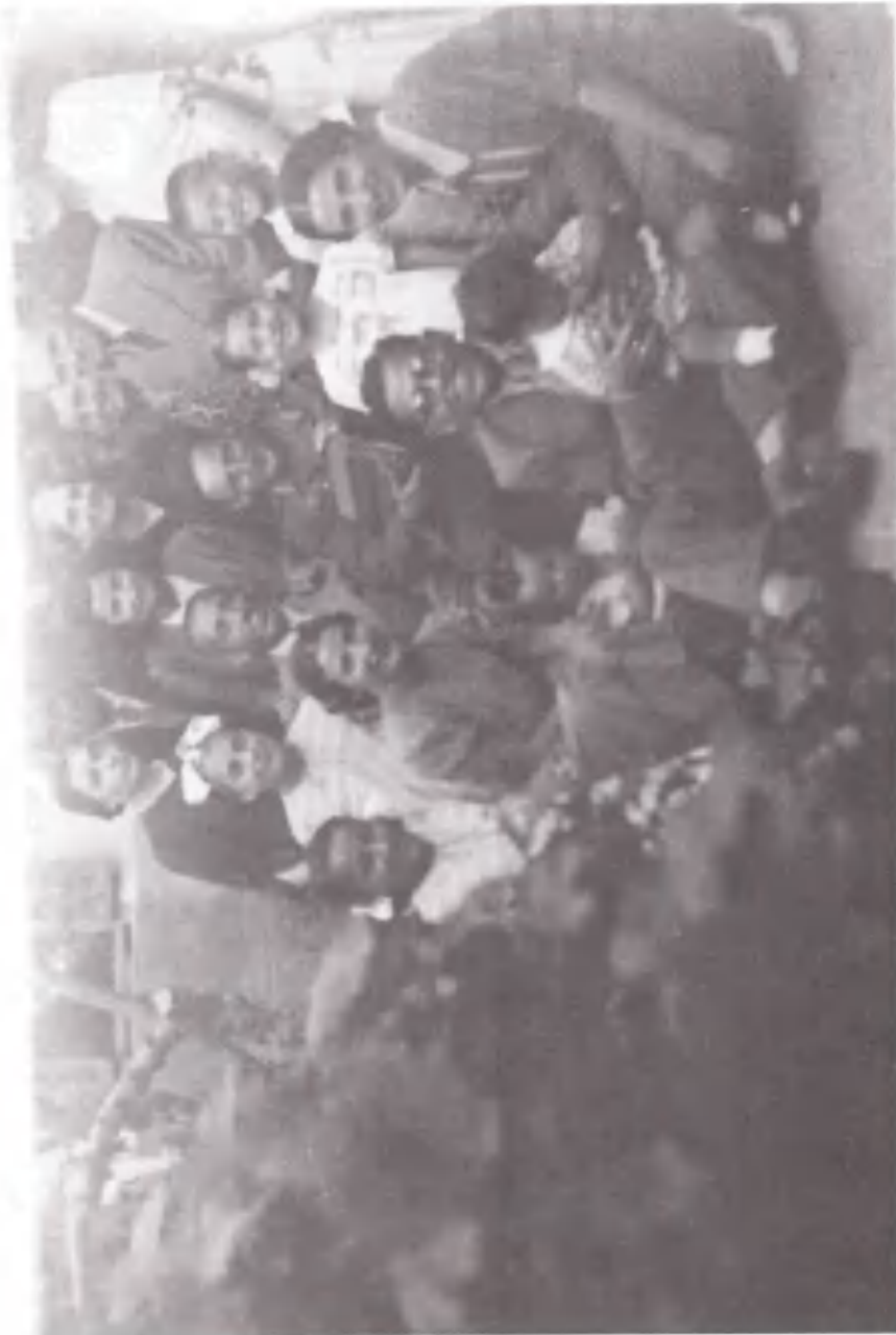
Ο Ζίγκφριντ Φούρμαν (στο κέντρο) με την αδελφότητα της Θεσσαλονίκης. Η Γερμανία γνωρίζει την Ελλάδα και το Σούνιο.