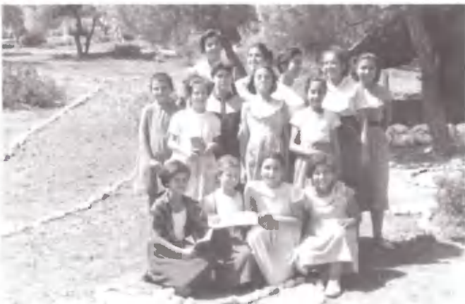
Γιασεμιά και κρίνα.