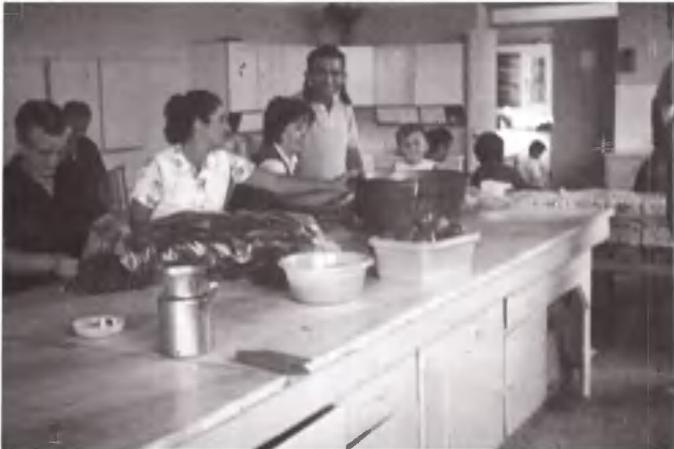
Κουζίνα του Σουνίου. Καμιά σύγκριση με αυτή της σκηνής.