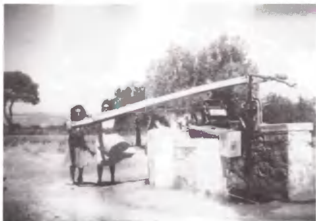
Άντληση νερού από το μαγγανοπήγαδο, με τα χέ- ρια.