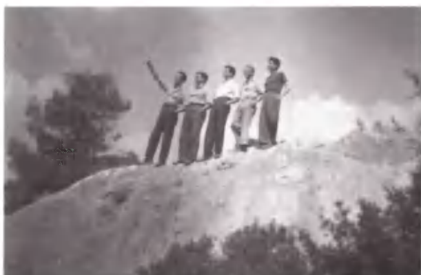
Αποθαιμάζοντας την ανατολή.