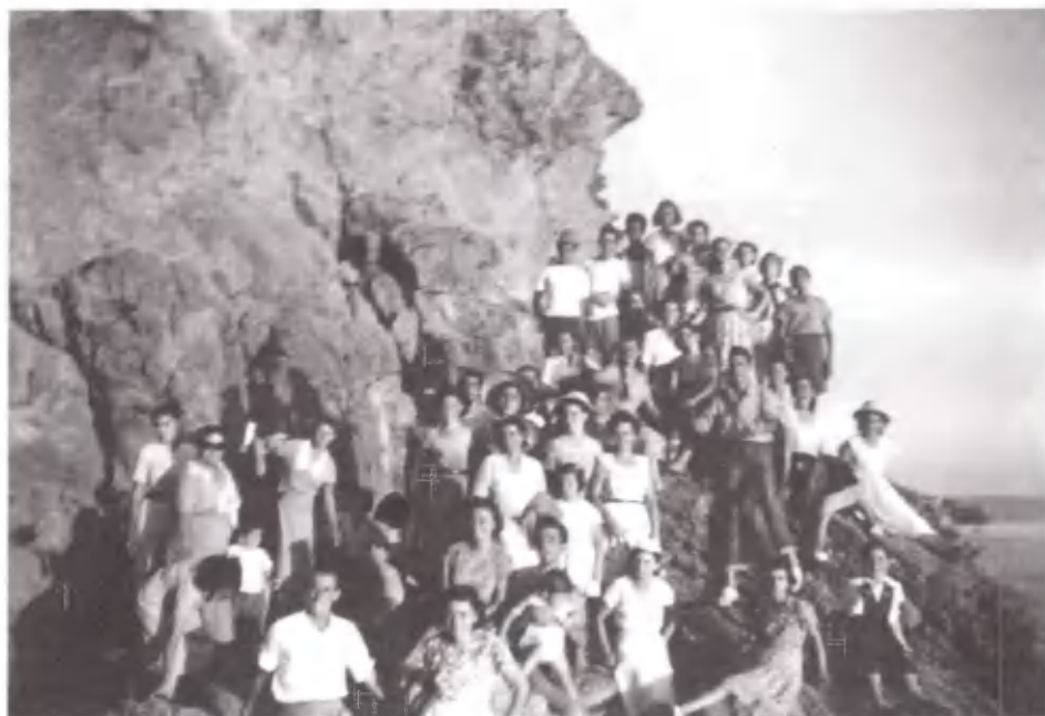
Περιηγήσεις στους βράχους του Σουνίου.