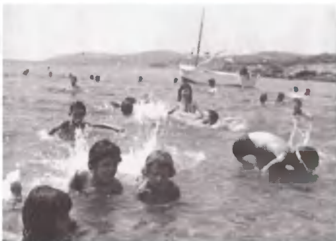
Και η χαρά της θάλασσας του Σουνίου.