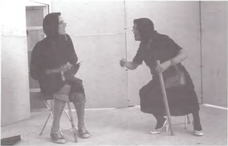
Οι γριές. Θεατρική παράσταση από τον Χαρίλαο Γεωργιάδη και Χρήστο Καρμπόνη. Η Κατασκήνωση ακόμα γελάει.