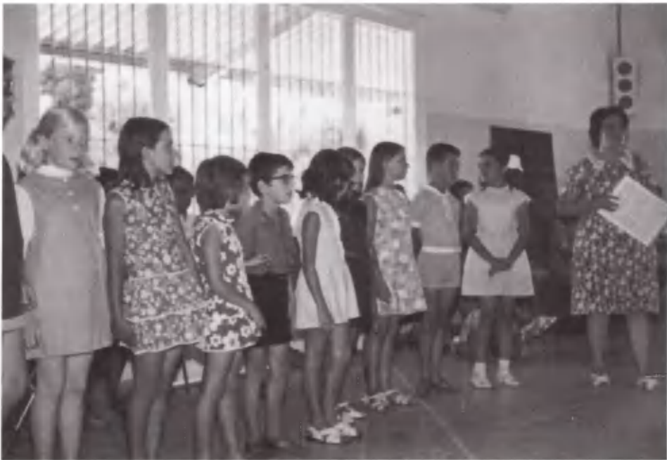
Τάξη Κυριακού στην αποχαιρετιστήρια γιορτή.