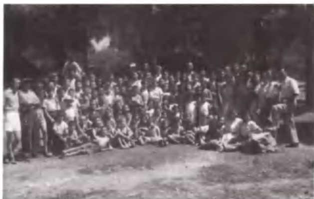
Μια ψυχή και ένα πνεύμα, Η Κατασκήνωση.