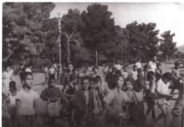
Ένας κόσμος στη χαρά της υπαίθρου.