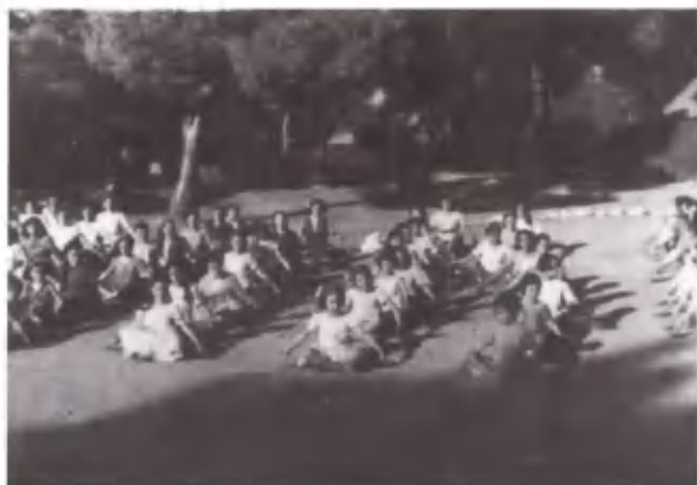
Κίνηση και τάξη συνθέτουν αρμονία.