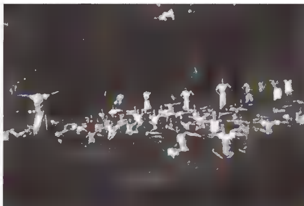
Νους υγιής εν σώματι υγιεί.