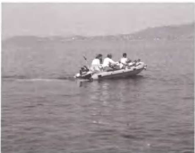
Ο Μάρκελλος με το φουσκωτό. Επιστροφή από τη Μακρόνησο.