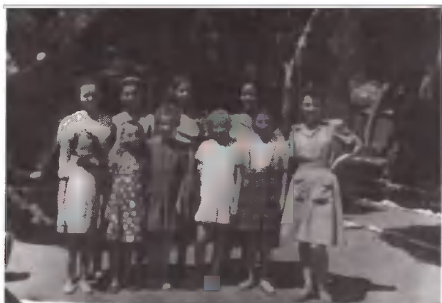
Προσθέστε στην πίστη, την αρετή....