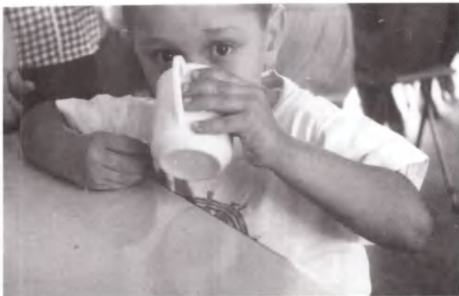
Ω, να ήταν κι άλλο.