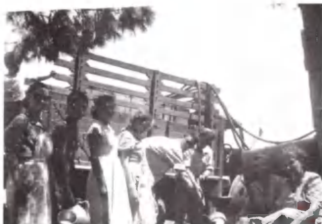
Μόλις το «λεωφορείο» έφτασε στην Κατασκήνω- ση. Αποβίβαση.