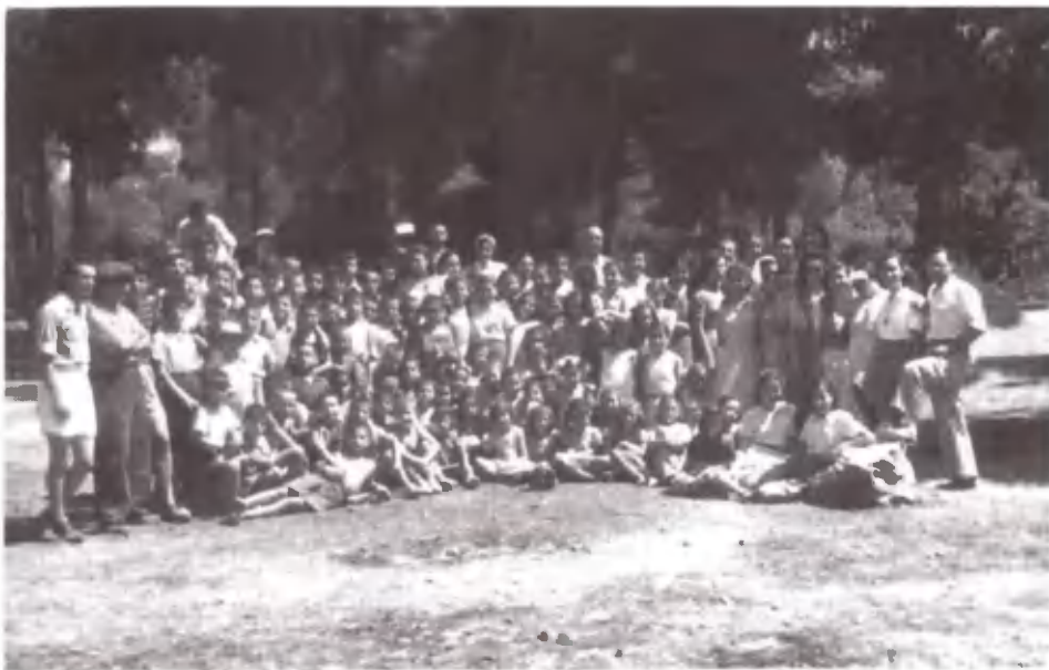
Παιδιά, ομαδάρχες, αρχηγοί, όλη η Κατασκήνωση.