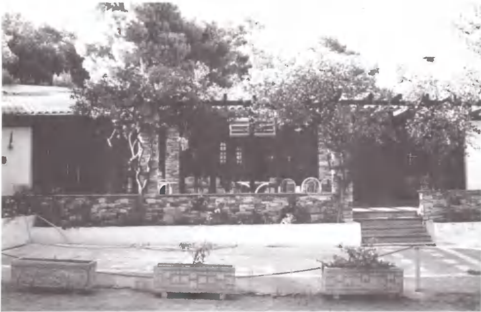
Η τραπεζαρία του Ξενώνα. Κοινωνία καρδιών και πνεύματος, δικών μας και ξένων.