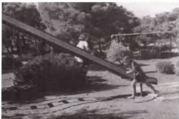
Γλιστρώντας στην τσουλήθρα.