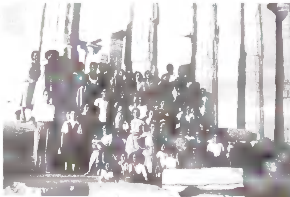
Εκδρομή στις κολόνες.