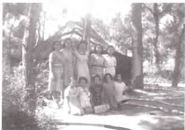
Μια άλλη ανθοδέσμη. Στελέχη και μωμπούκια της Κατασκήνωσης.