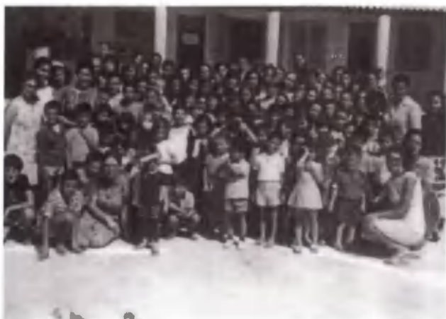
Ποζάρουν μπροστά από τις ομάδες στο Σούνιο.