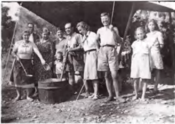
Η ντοματόσουπα έτοιμη. Όλοι χαρούμενοι... και πεινα- σμένοι.