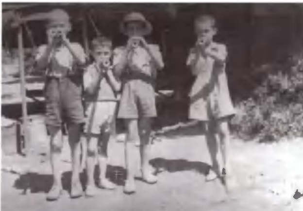
Ορχήστρα με αξιώσεις.