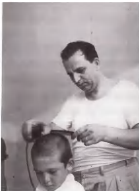
Ας όψεται ο κουρέας της Σεβίλλης.