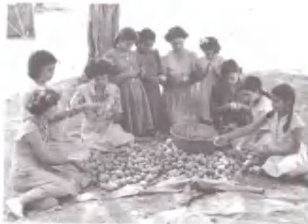
Όλοι στη δουλειά.