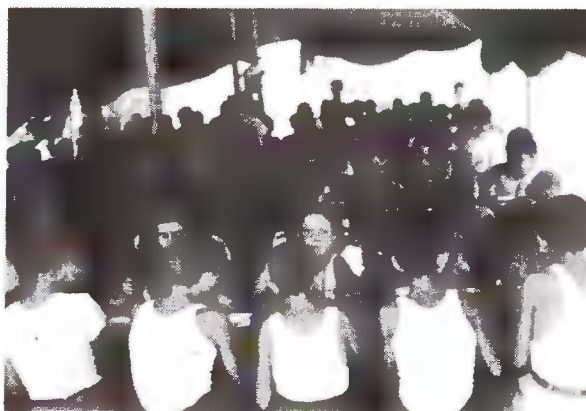
Η Κατασκήνωση επί το έργον. Μη μας ζηλεύετε.