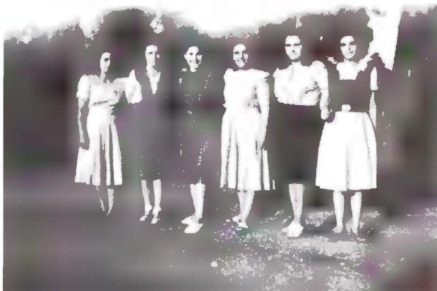
Νέες και έτοιμες για δουλειά.