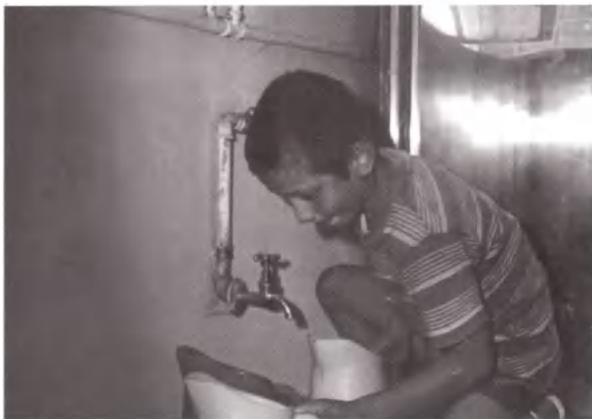
Γεμίζοντας τις κανάτες με δροσερό νερό.