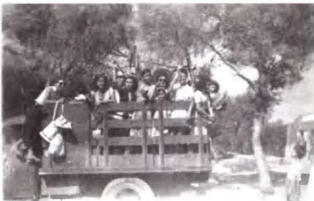
Μεταφορά κατασκηνωτών με τα πούλμαν της εποχής