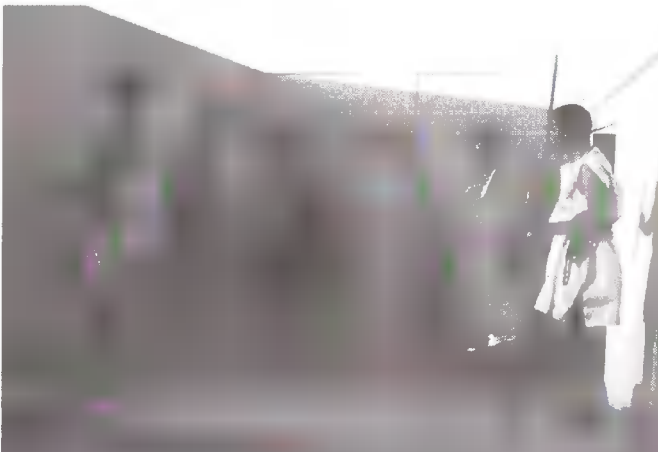
Ασπίδες, δόρατα, αμφιέσεις. Ένας αρχαίος κόσμος στη σκηνή.