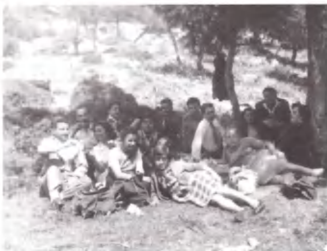
Μας ήρθαν και επισκέπτες.