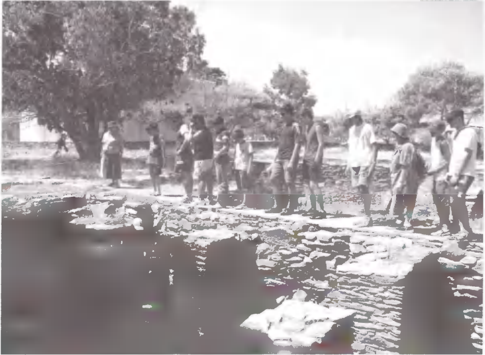
Η Σοφία Περιάλη ξεναγεί ομάδα κατασκηνωτών στον αρχαιολογικό χώρο της Τζιας.