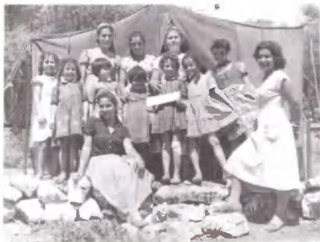
Περιμένοντας την επιθεώρηση.