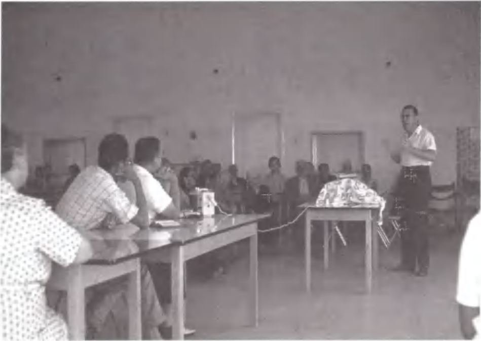
Κυριακή λατρείας στο Σούνιο. Κλείνοντας το «Δείπνο του Κυρίου».