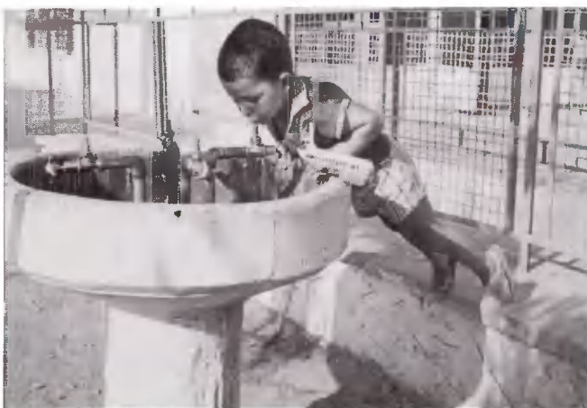
Μικρός, αλλά θαρραλέος. Σβήνει τη δίψα του στην Κατασκήνωση του Σουνίου, με τρόπο ακροβατικό.