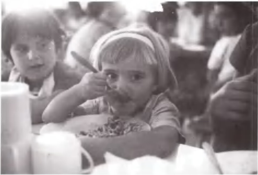
Μη με ζηλεύετε! Ελάτε στην Κατασκήνωση και σεις.