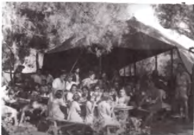
Και έως έξω από τη σκη- νή της τραπεζαρίας.