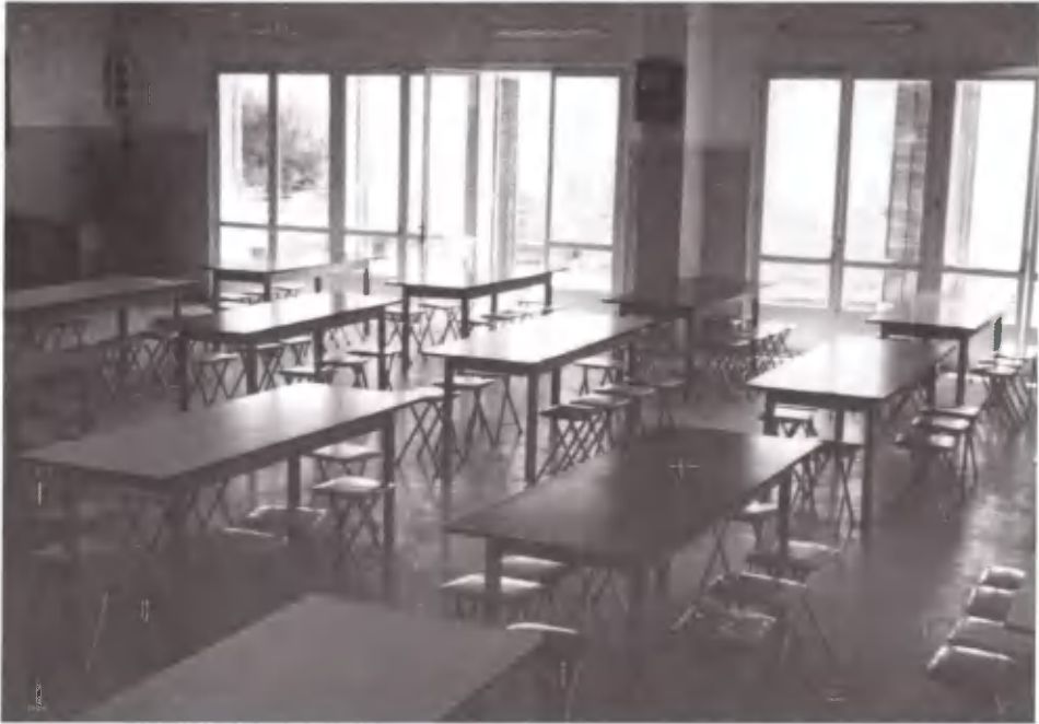
Τραπεζαρία και скаμνιά από τη Γερμανία. Χάρη στους φίλους, η Κατασκήνωση, δεν είναι όπως άρχισε.