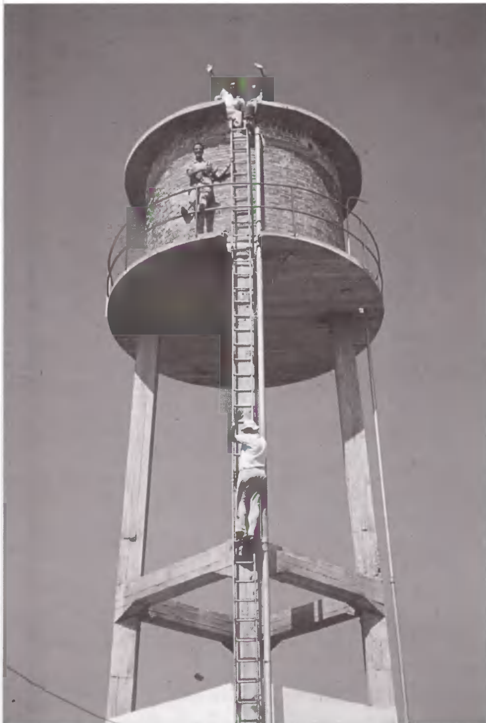
Ο υδατόπυργος. Σήμα αναγνώρισης της Κατασκήνωσης του Σουνίου. Το υψηλότερο κτίσμα της περιοχής.