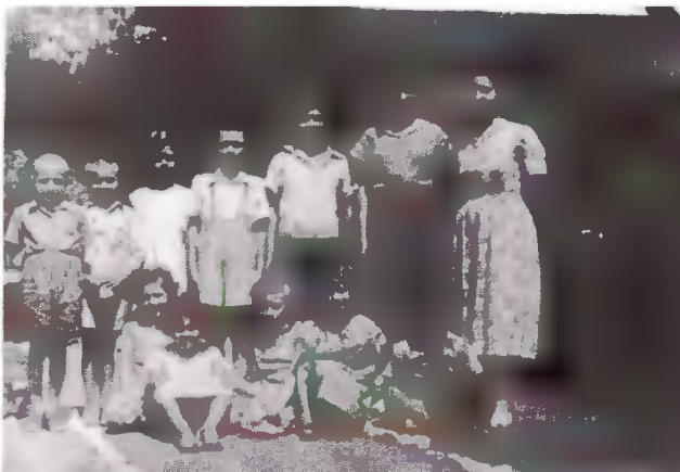
Ο κήπος μας έχει απ' όλα.