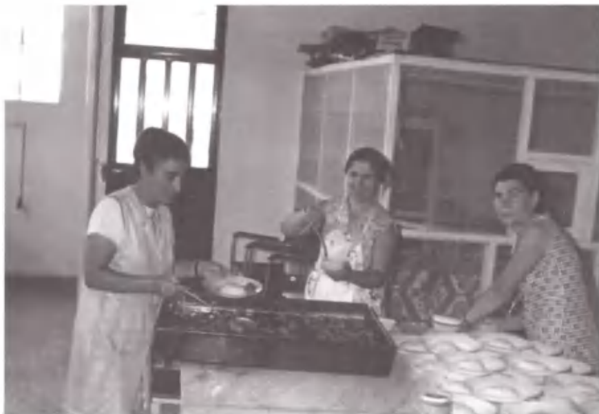
Όλα ωραία, καθαρά και νόστιμα.