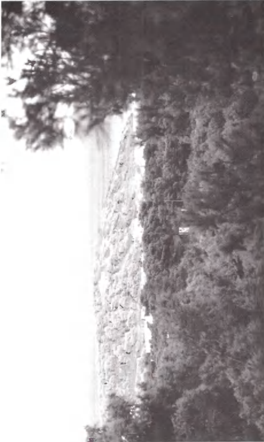
Ε.Χ.Ο.: Να κατασκηνώσουμε εδώ! Δεν είναι ωραία;