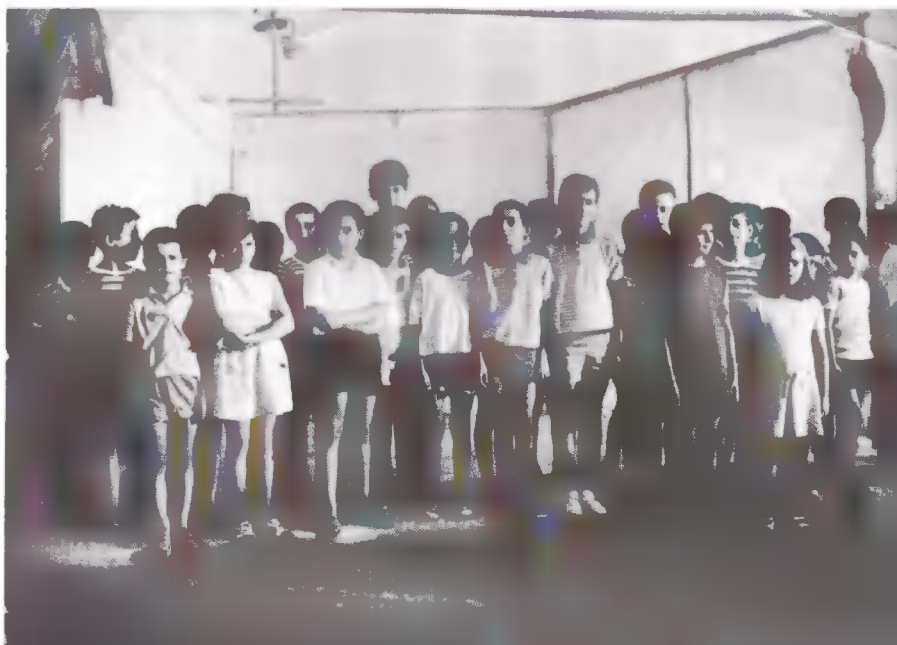
Οι παίκτες του σκετς επί σκηνής.