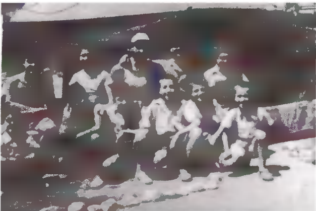
Η χαρά του Χριστού είναι η δύναμή μας.