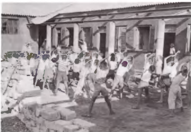
Και λίγη Σουηδική για την διάπλωση του κορμιού.