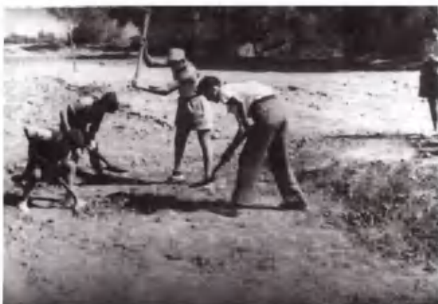
Το έδαφος πρέπει να ετοι- μαστεί.