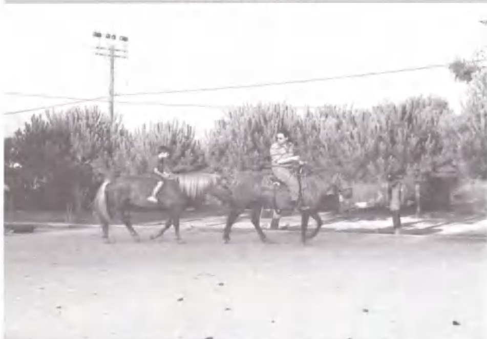
Ένα ιππικό, τι ιππικό! Εκμάθηση ιππασίας στο Σούνιο.