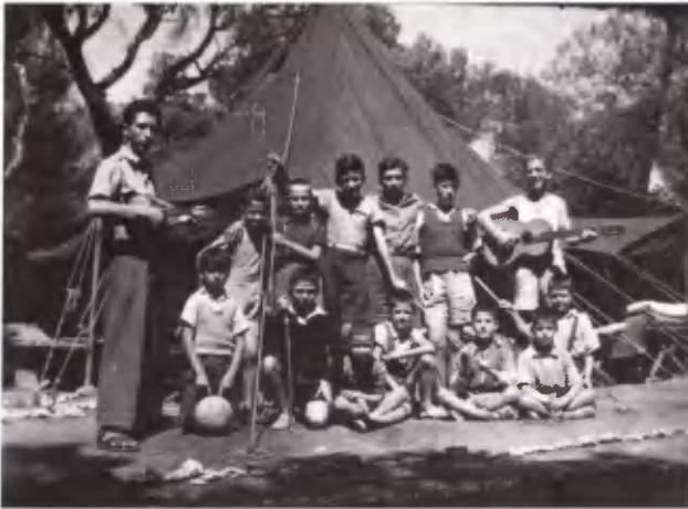
Επιτέλους μια ομάδα στη σκηνή τους. Αξίζει να το γιορτάσουν με όργανα και ύμνους.