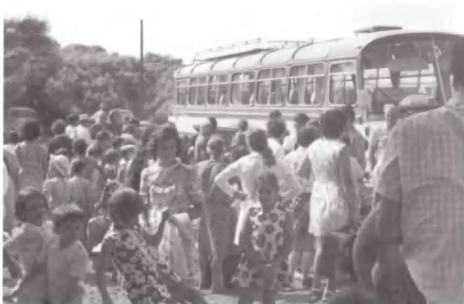
Σούνιο, Σούνιο... ω, πώς να σε αφήσουμε, εσύ είσαι η ζωή μας.