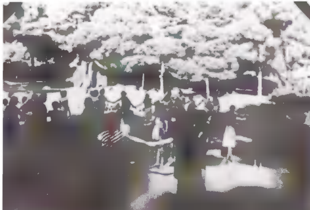
Αλυσίδα χαράς και αγάπης.