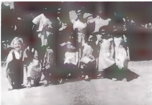
Ευωδιές και αρώματα.