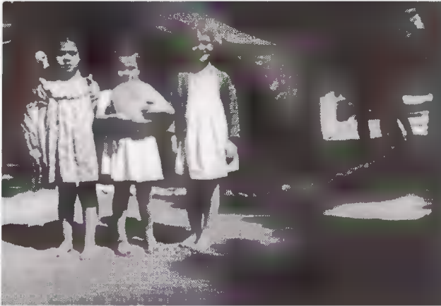
Πιο μεγάλο από το μπόι της.