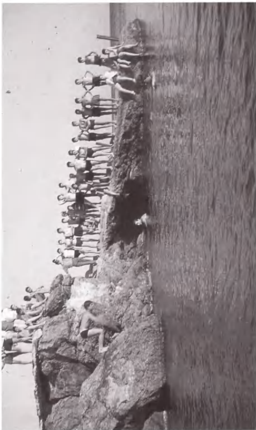
Οι βουτηχτές! Έτοιμοι για κατάδυση από την προβλήτα του Λέγκερη.