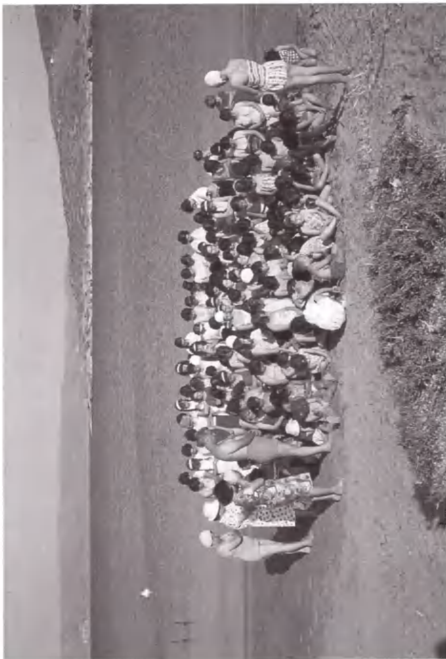
Προσευχή πριν από την κολύμβηση στα γαλανά νερά του Σουνίου