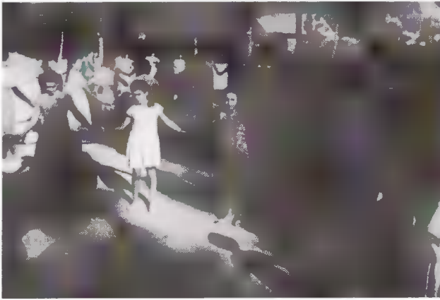
Γύρω, γύρω όλοι.