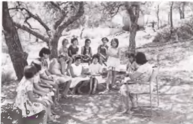
Αποστήθιση εδαφίων από το λόγο του Θεού στο πρωινό μάθημα.