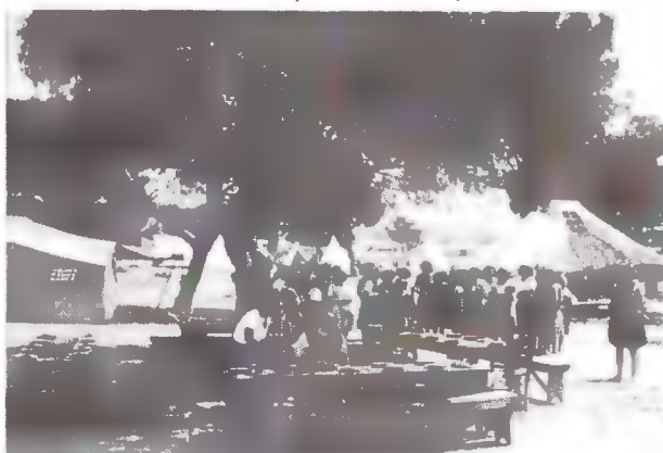
Σύναξη στελεχών για τον καθορισμό του προγράμματος.