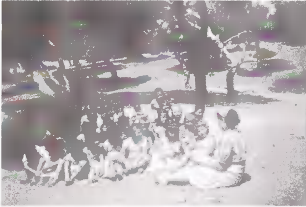
Δασκάλα και παιδιά στο υπαίθριο Κυριακό Σχολείο.