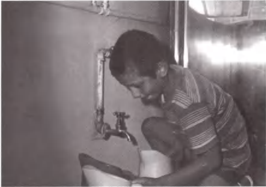
Γεμίζοντας τις κανάτες με δροσερό νερό.