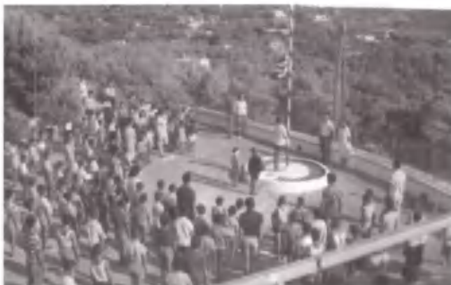
Χαίρε, ω χαίρε, λευτεριά!