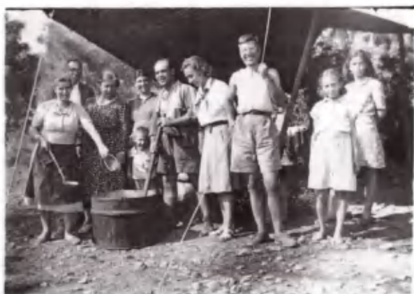
Η ντοματόσουπα έτοιμη. Όλοι χαρούμενοι... και πεινα- σμένοι.