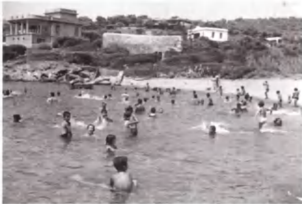
Λίγη δροσιά στο θερμό καλοκαίρι.