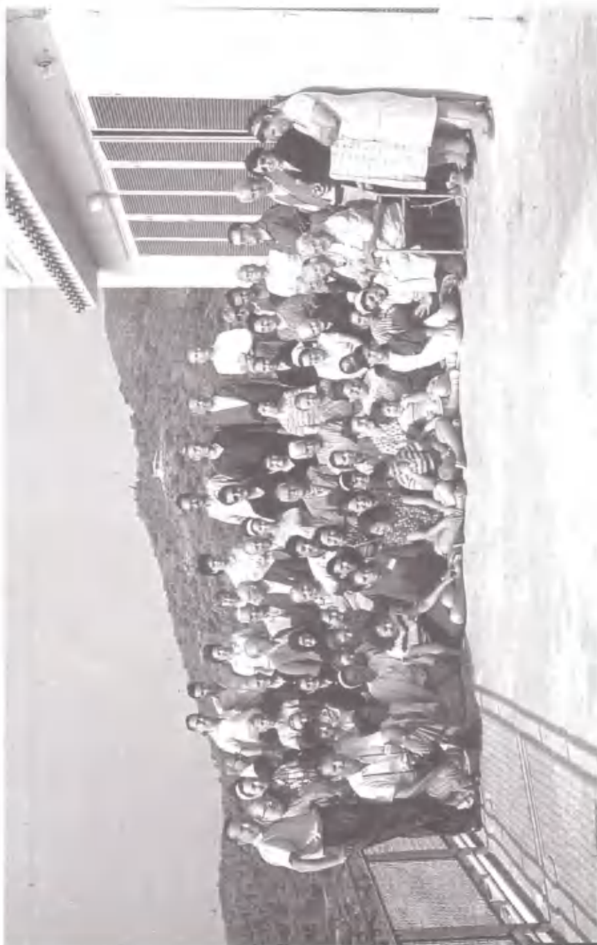
Στελέχη και φιλοί επισκέπτες στη βεράντα της τραπεζαρίας στο Σούνιο.