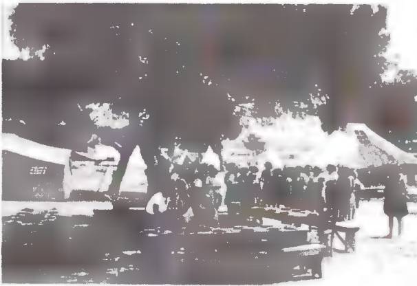
Σύναξη στελεχών για τον καθορισμό του προγράμματος.