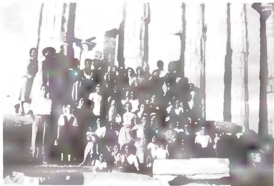
Εκδρομή στις κολόνες.