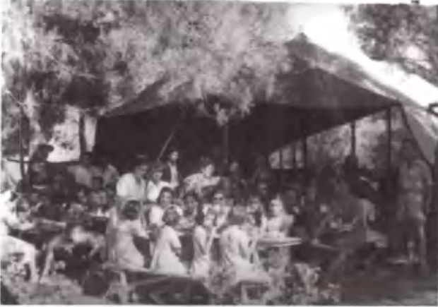
Και έως έξω από τη σκη- νή της τραπεζαρίας.