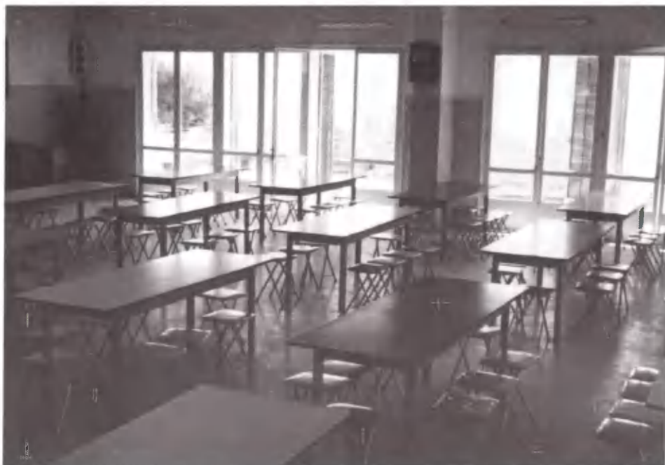
Τραπεζαρία και скаμνιά από τη Γερμανία. Χάρη στους φίλους, η Κατασκήνωση, δεν είναι όπως άρχισε.