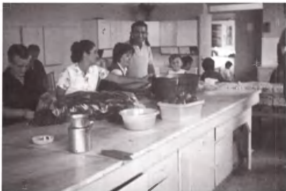
Κουζίνα του Σουνίου. Καμιά σύγκριση με αυτή της σκηνής.